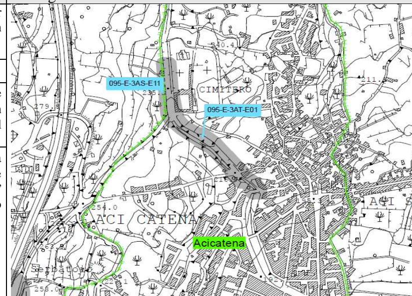
Immagine tratta tavola Pericolosità Idraulica n°19 del P.A.I.

Scenario Possibile esondazione del torrente nei nodi di intersezione con le vie: Cimitero, Scale S. Antonio e Spoto, con conseguente invasione di parte del centro abitato.